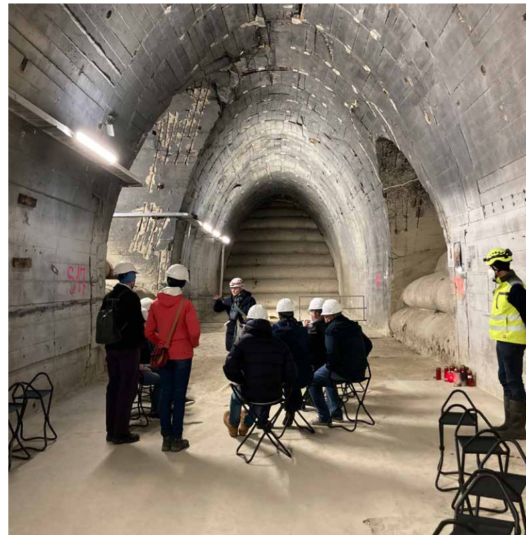
KZ Gusen / Langenstein 1945 und heute Gusen concentration camp / Langenstein 1945 and today

Gleichzeitig hat die KZ-Gedenkstätte Mauthausen einen Beteiligungsprozess zur Einbindung einer breiten Öffentlichkeit ins Leben gerufen. Gemeinsam mit regionalen, nationalen und internationalen Interessensgruppen soll ein abgestimmter Masterplan mit gestalterischen und funktionalen Rahmenbedingungen für die neu angekauften Grundstücke erarbeitet werden. Dieser soll danach die Grundlage für einen Wettbewerb zu deren Gestaltung und Anbindung an die bestehende KZ-Gedenkstätte Gusen bilden. Mit der Einladung an unterschiedlichste Organisationen im In- und Ausland zu diesem gemeinsamen Diskussionsprozess geht die KZ-Gedenkstätte Mauthausen einen neuen Weg der gesellschaftlichen Teilhabe an der Kultur des Gedenkens und der Politik des Erinnerns an die Verbrechen des Nationalsozialismus.